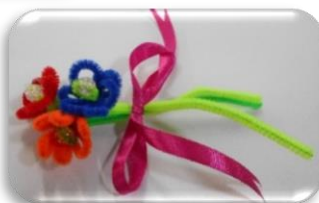
モールで花を作りました。 奥様へプレゼントするそうです